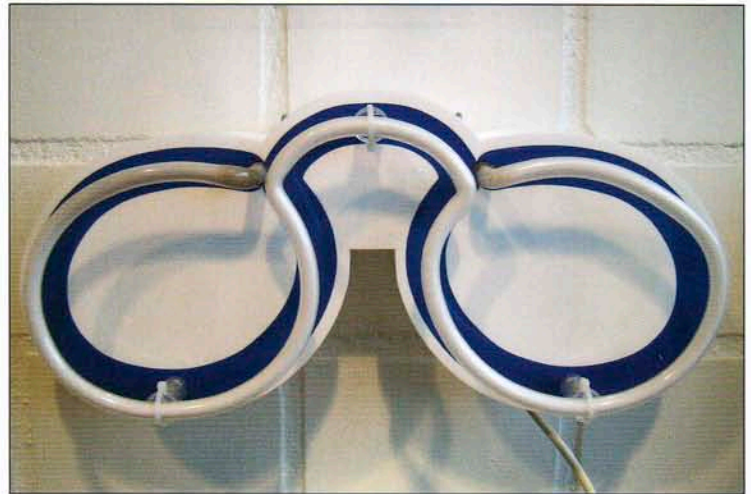
Eine formgefräste Grundplatte und offen liegendes Neon sind Bestandteile der Neoneonpiktogramme.