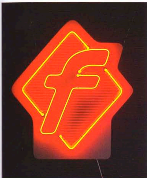
Appetit auf ein Würstchen? Der Fleischer hilft gern.

Die 1987 in Münster gegründete Firma ANS American Neons widmete sich anfangs dem Vertrieb amerikanischer Neondesigns. Später stellte sie individuelle Objekte her. Heute zählen unter anderem Leuchtdisplays und -stäbe, Leuchtstoffröhren, Licht-Filterröhren, Leuchtkästen und Lichtgardinen zum Sortiment. Seit 2002 bildet der Betrieb im kaufmännischen und mediengestalterischen Bereich aus. Er macht gegenwärtig circa drei Millionen Euro Umsatz und verfügt mittlerweile über eine Niederlassung in den USA sowie eine Produktionsstätte in Lettland. Der deutsche Standort verfügt über eine eigene Glasbläserei. ANS hält ungefähr 45 TÜV-Zertifikate und mehrere Patente sowie Schutzmarken, zum Beispiel für das auf einem Leuchtstab basierende Schildsystem Way-Light. Das Unternehmen überholt auch beschädigte und verschmutzte Neonobjekte.